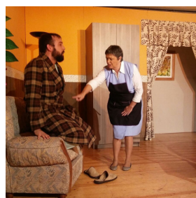
Imagen de "Tengo un millón"

El próximo día 15 de Junio, el grupo de Teatro "Trama" representará en Soto del Barco la obra " Tengo un Millón ", de Víctor Ruiz Iriarte.